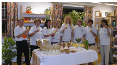
Ein Teil des Bibliotheksteams von 2001

Bald steht für uns ein ganz besonderes Ereignis bevor: Heuer feiern wir unser 25-jähriges Bestehen.