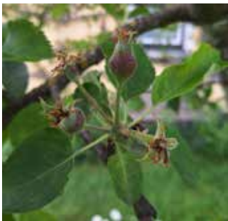
Bild: Büschel mit 4 Äpfeln

Um zu verhindern, dass eure Bäume zu viel Kraft für die Fruchtbildung aufwenden und im nächsten Jahr nicht fruchten, sollten bis Mitte Juni pro Fruchtbüschel nur die 2 schönsten Früchte belassen und die restlichen weggenommen werden.