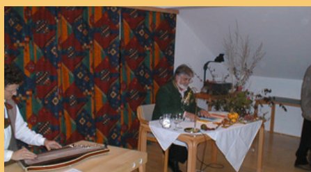
Lesung mit Herbert Gschwendtner

Ein besonderer Moment war auch die erste Lesung nach der Gründung: Im Oktober 2001 durfte die Bibliothek den bekannten Autor Herbert Gschwendtner begrüßen und damit gleich zu Beginn ein kulturelles Highlight setzen.