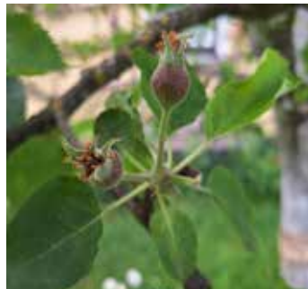
Bild: Ausgedünnt auf 2 Äpfel