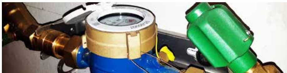
Regelmäßige Kontrolle des Wasserzählers spart unnötigen Ärger und Kosten

Denken Sie auch an Leitungen und Wasserverbraucher außerhalb des Hauses, wie z. B. Leitungszweigungen in die Garage, andere Nebengebäude oder zum Garten. Ist ggf. ein Außenhahn länger unbemerkt gelaufen oder nicht ganz dicht?