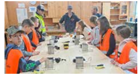
Die 4b Klasse